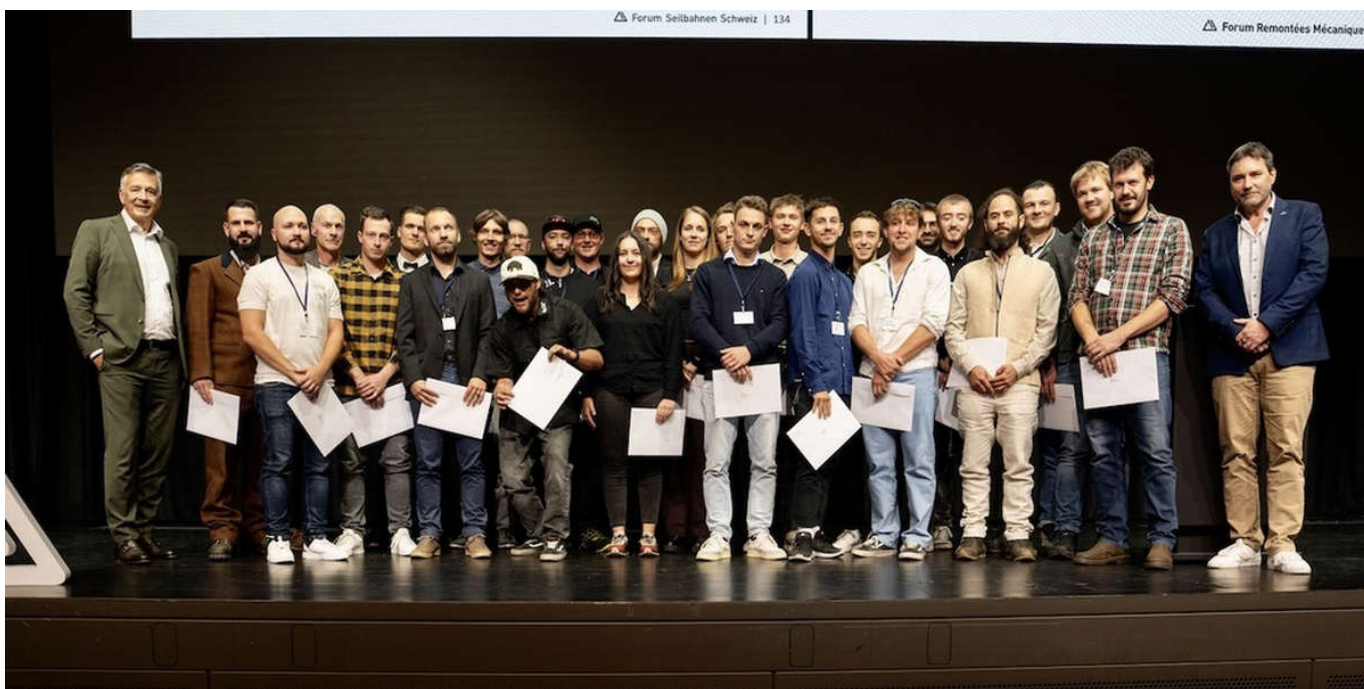
32 neue Seilbahnfachleute erhielten ihre Urkunden. 2 / 7