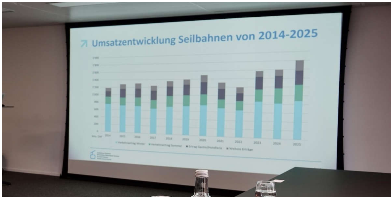
Impressionen vom Forum Seilbahnen Schweiz am 28. Oktober 2025 in Rapperswil-Jona 7 / 7