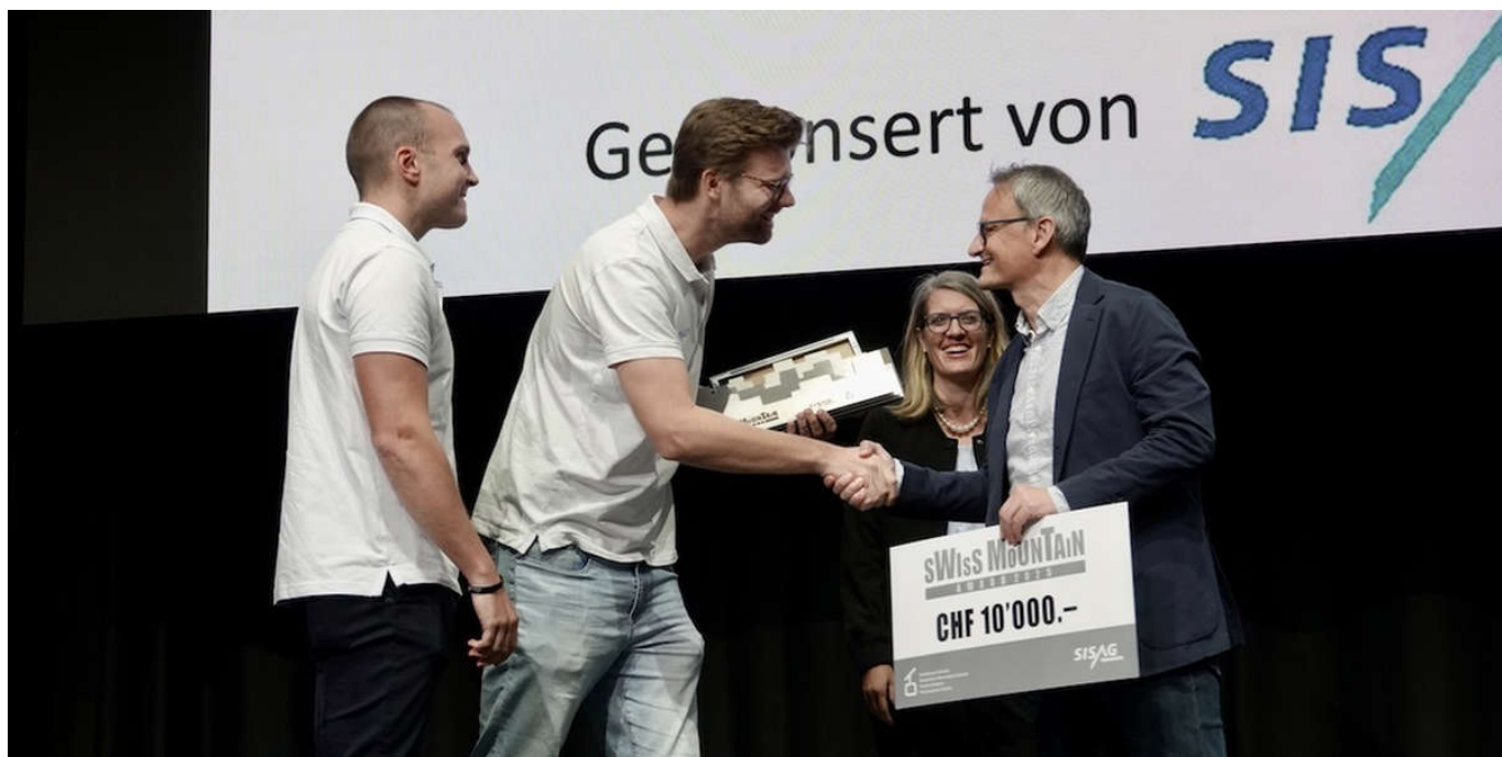
Die Gewinner des prestigeträchtigen Swiss Mountain Award: die Mantis Ropeway Technologies AG.