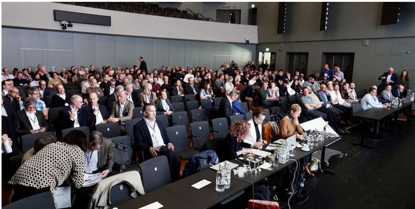
Impressionen vom Forum Seilbahnen Schweiz am 28. Oktober 2025 in Rapperswil-Jona 3 / 7