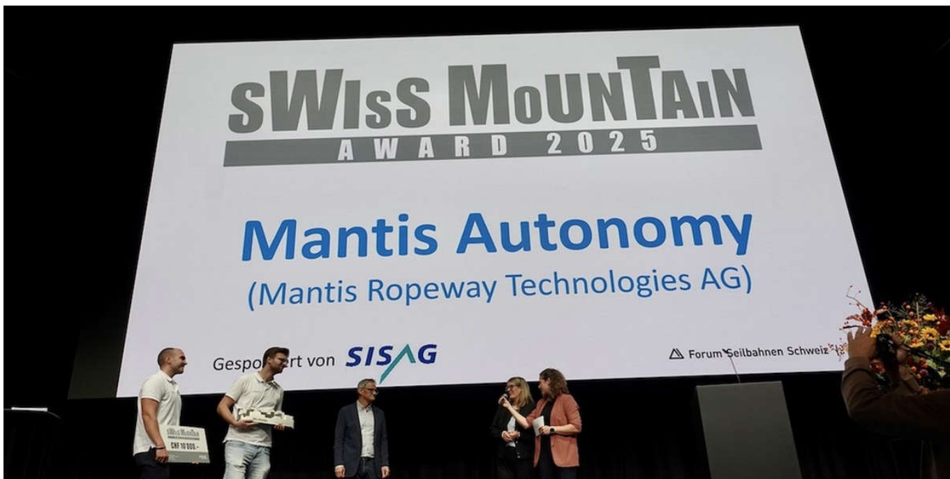
Swiss Mountain Award 2025. Gewonnen hat die Mantis Ropeway Technologies AG. 4 / 7