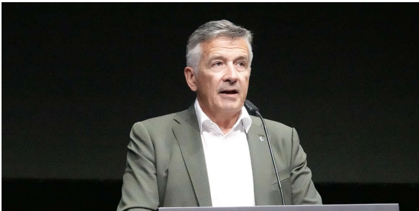
Ständerat Hans Wicki, Präsident Seilbahnen Schweiz. 1 / 7