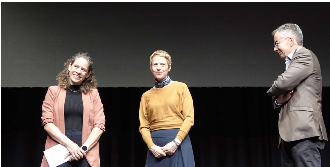
Impressionen vom Forum Seilbahnen Schweiz am 28. Oktober 2025 in Rapperswil-Jona 4 / 7