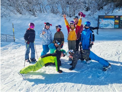
Primarschule Wald/AR Schüler:innen beim Gruppenfoto im Pizolgebiet